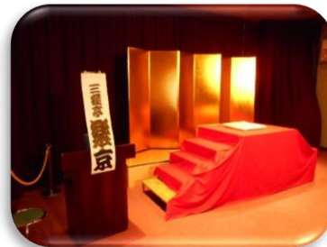
(1階 iスペースは、瞬間に独演会の会場に様変わり)